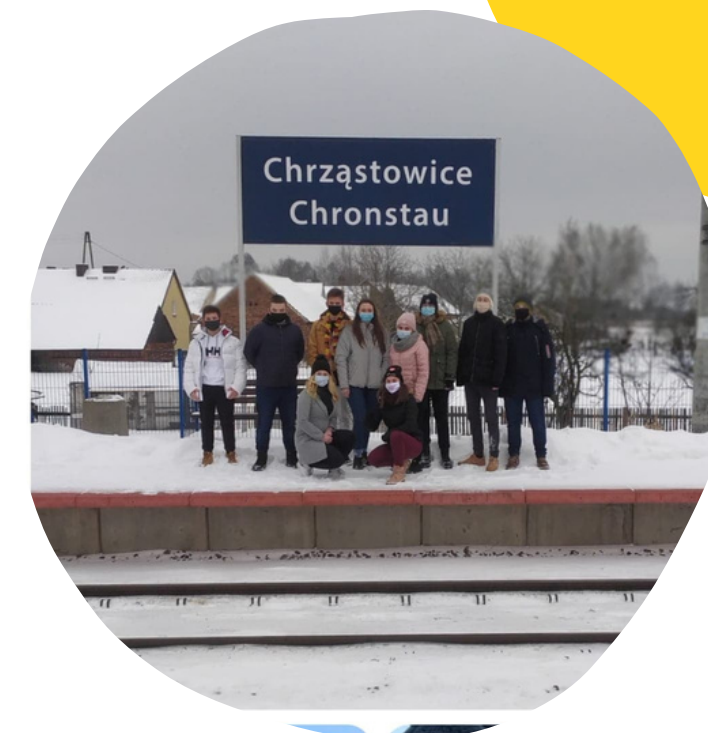
aktywność sportowa wycieczki