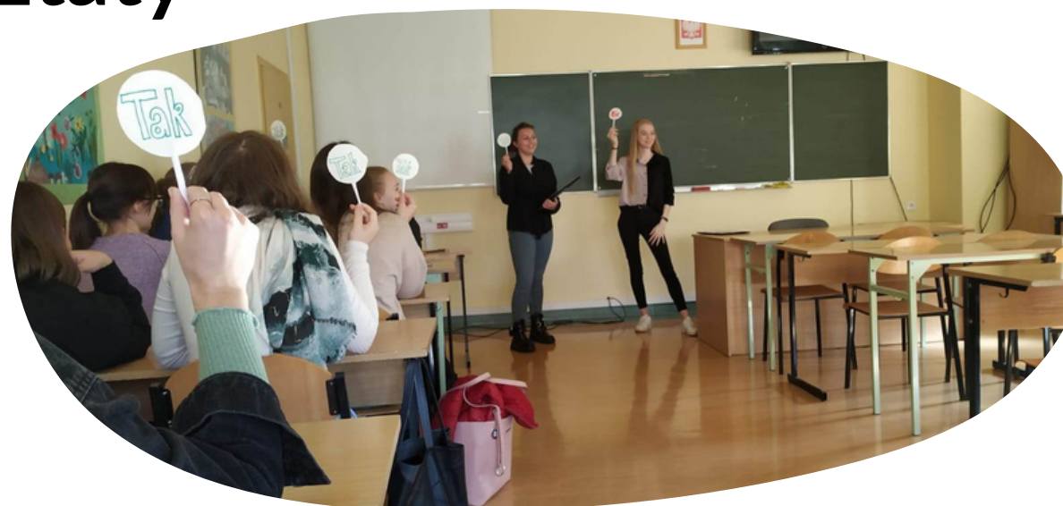
ścieżki dydaktyczne wykłady